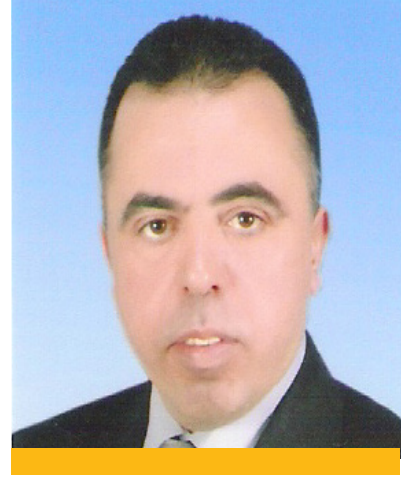
بقلم عصام شاور

تمادى جيش الاحتلال في جرائمه ضد الشعب الفلسطيني في الضفة الغربية، أعداد الشهداء والجرحى والأسرى في تصاعد كبير، هناك مخططات صهيونية للسيطرة التامة على مناطق «سي» بالاستيطان وإفراغها من السكان الفلسطينيين، وذلك بهدم البيوت والتضييق ومصادرة الأراضي، وغير ذلك من الانتهاكات التي من شأنها تحقيق هدف الإحلال الذي تمارسه قوات الاحتلال في جميع الأراضي الفلسطينية المحتلة منذ عام 1948.